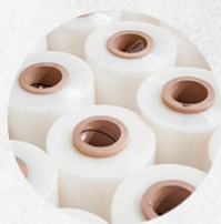
STRETCH colorido e incolor

Estaremos nos stands 15 e 16, apresentando algumas das nossas principais soluções: