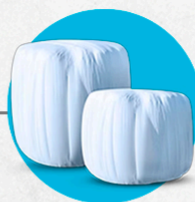
AGRO filmes, lonas e sacos