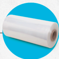
BLUE PE produtos com resinas sustentáveis